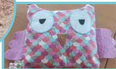
La mascotte Scarlette la chouette

Après un voyage dans le Moyen-Âge avec la visite du château de Guédelon, l'an passé, cette année, l'école élémentaire envisage une sortie au château de Chambord.